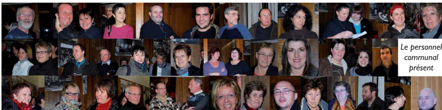
Le personnel communal présent

Le 12 janvier dernier, le Maire retrouvait les agents de la commune pour formuler ses vœux au personnel. L'occasion de réunir l'ensemble des services et les élus pour un temps d'échange sur des sujets qui concernent les missions de chacun. Un moment partagé en toute convivialité.