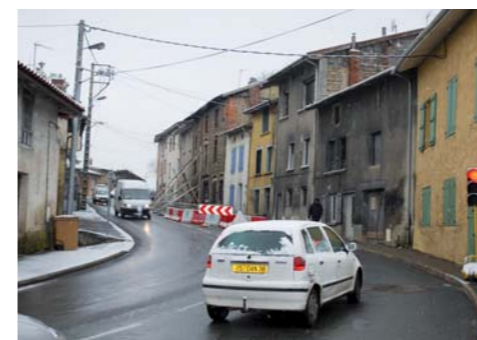
Avenue Victor Hugo – février 2010

La circulation sur l'avenue Victor Hugo est perturbée depuis plusieurs semaines. Une « procédure de péril » sur la voie publique a été déclenchée.