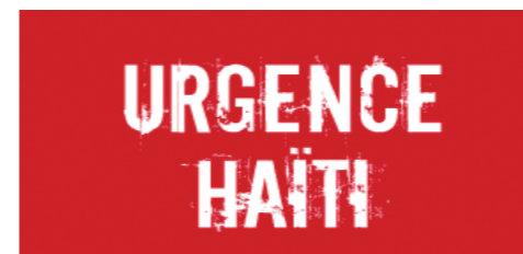
Visuel Handicap International

Suite au séisme d'une magnitude de 7,5 sur l'échelle de Richter survenu à Haïti le 12 janvier dernier, de nombreuses associations se mobilisent aux côtés des pouvoirs publics et des ONG pour porter secours à toute une population meurtrie et sinistrée.